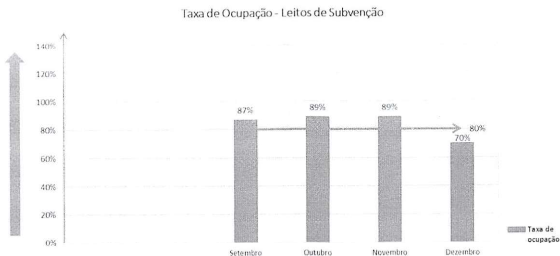
Gráfico 1: Taxa de Ocupação Hospitalar – Leitos de Subvenção 09/2023 a 12/2023

Forma de Cálculo: (Número de pacientes dia atendidos/número de leitos dia x 100)