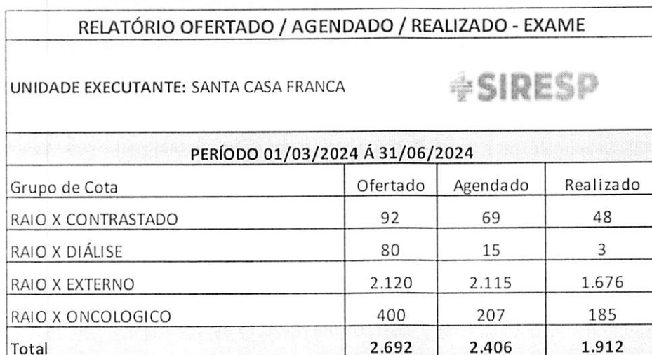
Tabela 1 – Exames ofertados e realizados – março a junho/2024

Indicador de resultado: Percentual de exames disponibilizados no SIRESP.